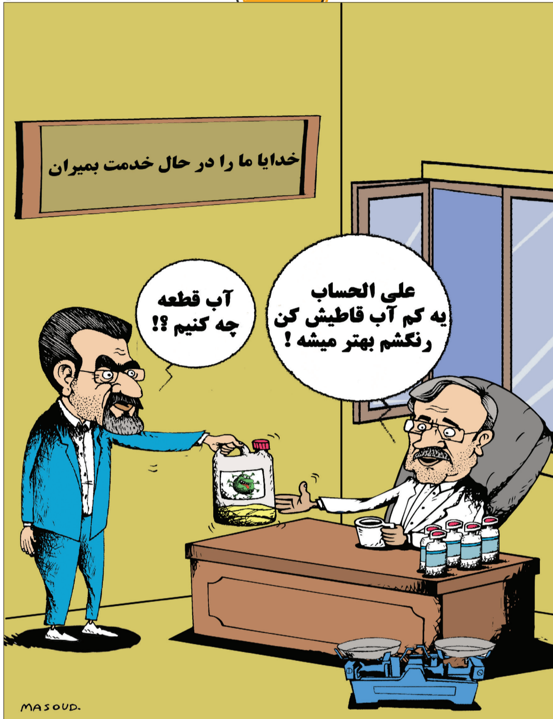
قرار بود روسیه ۶۲ میلیون واکسن بدهد، دو میلیون داد