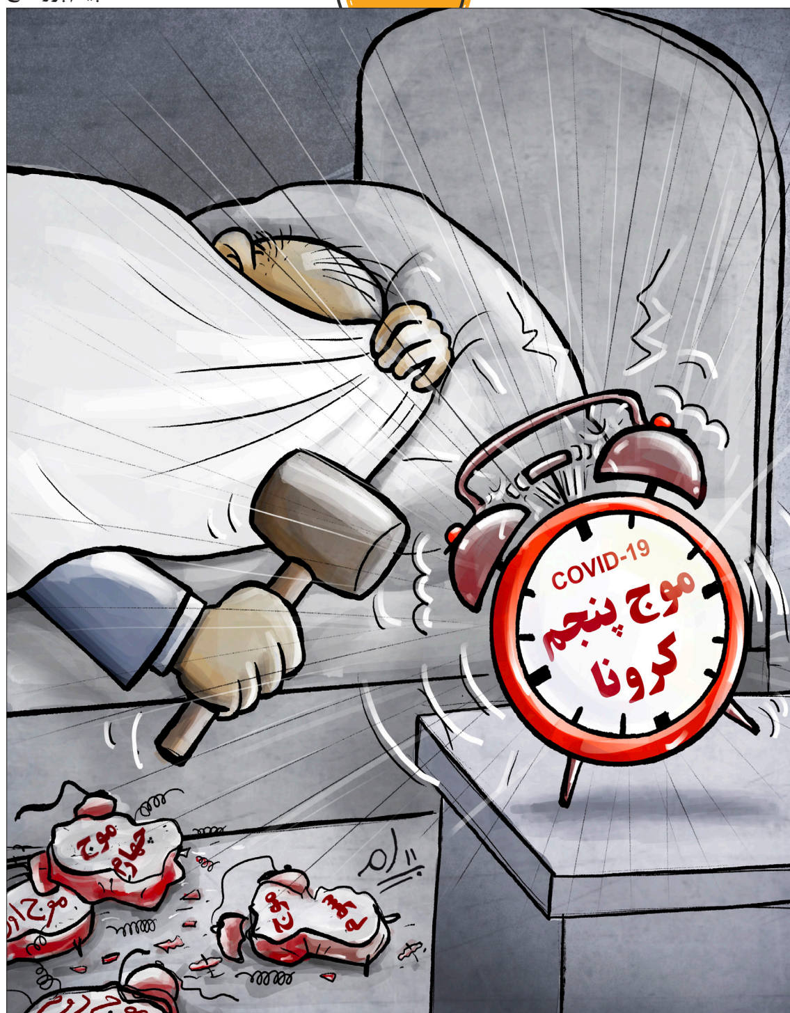
موج پنجم هم رسید!