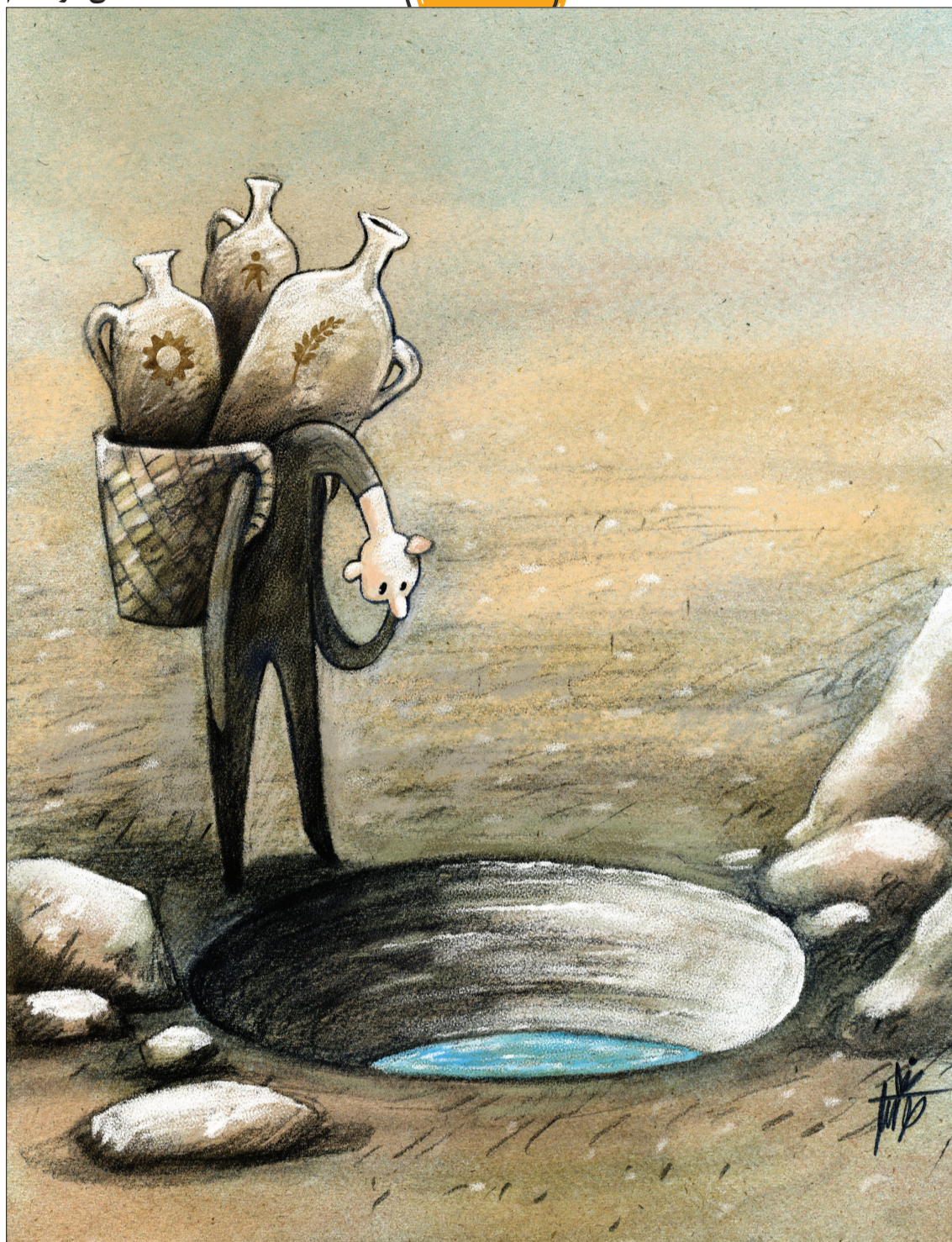
فقط ۲۴ درصد ذخیره آبی سد زاینده رود باقی مانده است