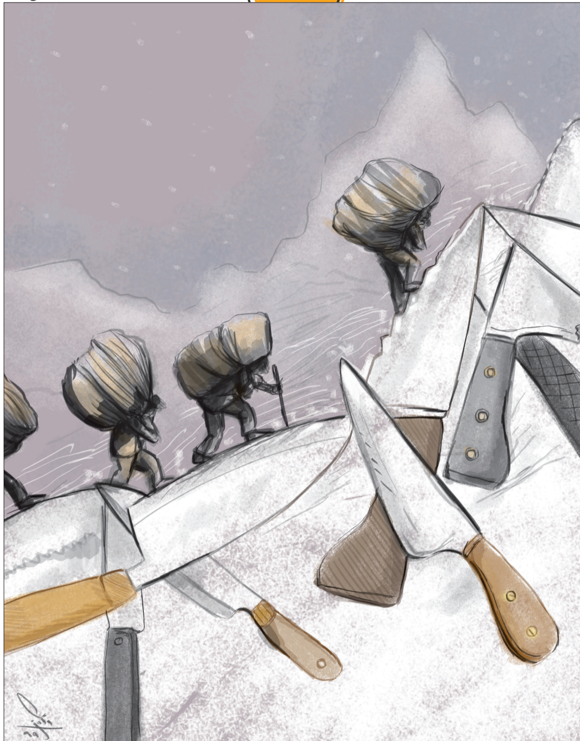
کولبری بر لبه های تیغ