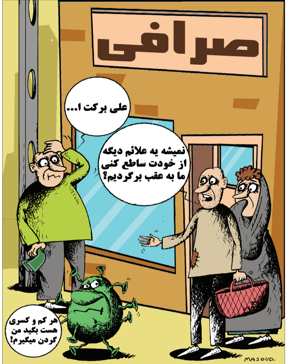
توهم و زوال عقل از علائم جدید ویروس کرونا