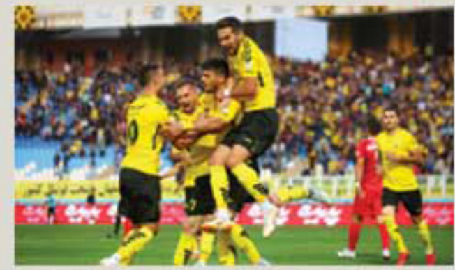
دیدار حساس - سپاهان - مس فردا در جام حذفی