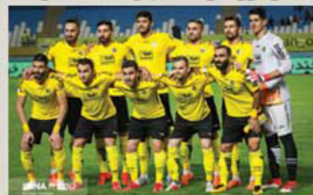
سایت روزنامه نصف جهان

رسانه هایی که در مورد برنده نقل و انتقالات تابستانی در چند هفته گذشته موضع گیری های خود را اعلام داشتند، حالا با گذشت چند هفته و با توجه به کیفیت خرید تیم ها نظرشان را تغییر داده اند و عمده آنها حالا سپاهان را برنده واقعی نقل و انتقالات در خرید بازیکنان با کیفیت و تاثیر گذار می دانند.