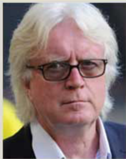
استقلال همیشه عادت به عقبگرد دارد