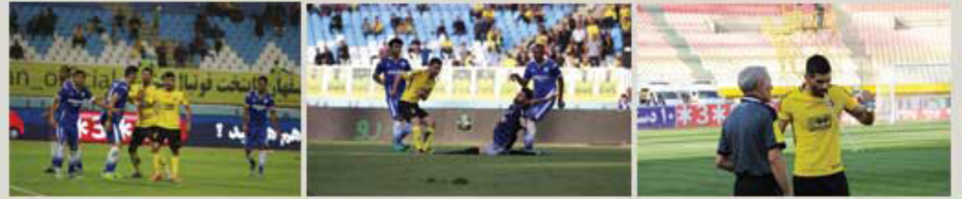
تیم فوتبال سپاهان با پیروزی برابر شهرداری ماهشهر به مرحله یک هشتم نهایی جام حذفی صعود کرد.

در چارچوب رقابت های مرحله یک شانزدهم نهایی جام حذفی فوتبال دیروز (جمعه) تیم سپاهان موفق شد با نتیجه ۳ بر یک از سد شهرداری ماهشهر بگذرد.